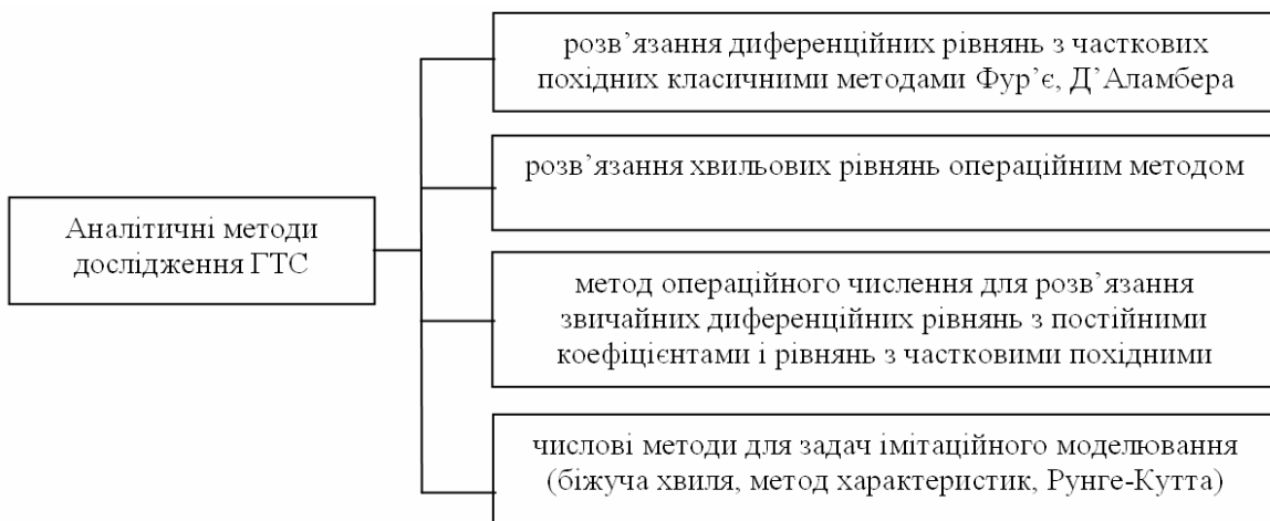
Рисунок 2 – Аналітичні методи дослідження ГТС

У зв'язку з різною фізичною природою процесів, які відбуваються в ГТС, та їх стохастичністю синтез автоматизованих систем управління є досить складною процедурою, яка залежить від класу і властивостей об'єктів керування. Різноманітність класів об'єктів призводить до необхідності створення різних методів ідентифікації й управління, що використовуються під час їх синтезу, який передбачає