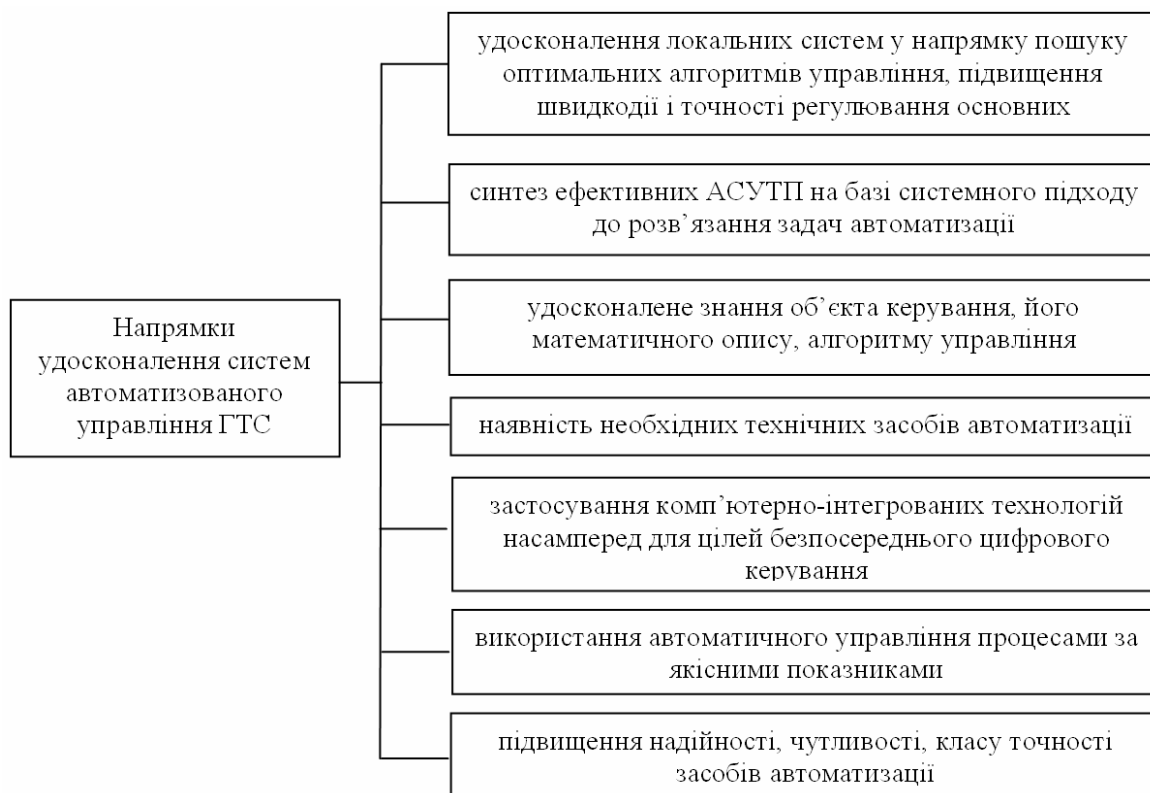
Рисунок 3 – Напрямки удосконалення систем автоматизованого управління ГТС

ки складністю конфігурації структури ГТС, але й відносно складністю розроблення ефективних алгоритмів управління, що суттєво залежить від адекватності отриманих математичних моделей окремих елементів ГТС.