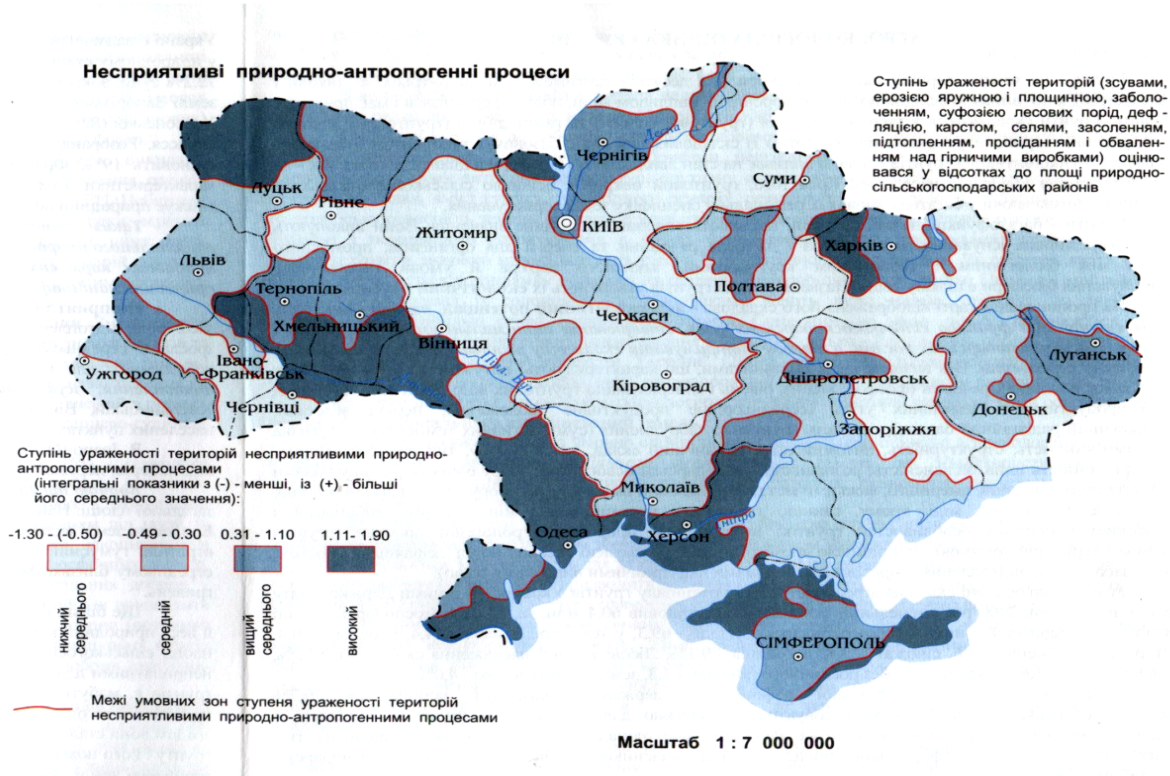
Рисунок 2 – Несприятливі природно-антропогенні процеси середовища (карта України „Агроекологічна оцінка ґрунтів”) [9]