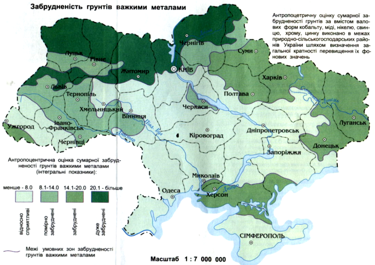
Рисунок 3 – Забрудненість ґрунтів важкими металами середовища (карта України „Агроекологічна оцінка ґрунтів”) [9]