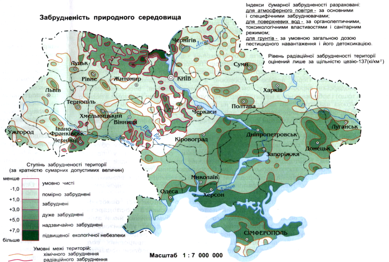
Рисунок 1 – Забрудненість природного середовища (карта України „Техногенне навантаження на природне середовище”) [8]

цифіка, пов'язана з особливостями фізико-хімічних властивостей газу, його підвищеною міграційною здатністю і можливістю фазових змін у пласті, свердловині, промислових і газотранспортних системах.